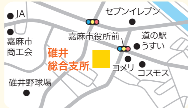
嘉麻市上白井446番地1