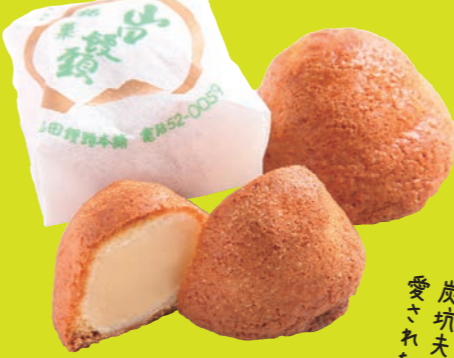
山田饅頭 120年以上の歴史を持つ伝統名菓。ボタ山をイメージした素朴な形で、皮の香ばしさと黄身餡の甘さが口の中に広がります。(1個 90円) 山田饅頭本舗 MAP D-4 嘉麻市上山田1405-1 ☎0948-52-0059 ☎10:00~18:00(なくなり次第終了) 日曜