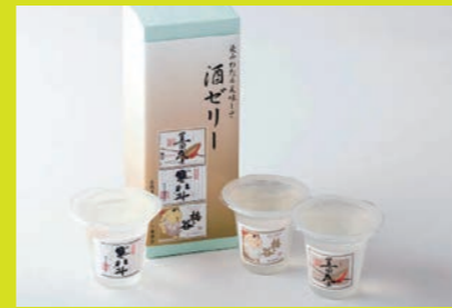
酒ゼリー 黒寒梅(くろかんばい) 嘉麻市の酒造会社3社の代表銘柄がゼリーに。清酒本来の特徴・風味を生かした味に仕上げられ、それぞれの芳醇なお酒の香りと絶妙な甘味がたまらない! 下記店舗にて販売中。(3個入 850円) ミュゼドモーツァルト 山田工場直売店 MAP D-4 嘉麻市下山田15-1(トモス山田工場内) 道の駅うすい 嘉麻市上臼井328-1 MAP B-4