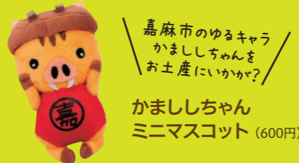
嘉麻市のゆるキャラ かまししちゃんを お土産にいかが? かまししちゃん ミニマスコット (600円)