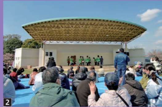
2 さくらまつり嘉麻 桜の名所 稲築公園で行われ、地元芸能などのステージイベントで花見気分を盛り立てます。