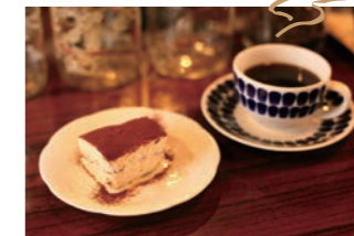
ミッチーの手づくりティラミスコーヒーセット 800円

昭和51年開店より、甘みと鮮度にこだわり、良質なスペシャルティ豆とプレミアム豆を厳選し日々焙煎。本来の旨みを引き出した豊かな味わいのコーヒーが味わえます。嘉麻市鴨生240 2階 ☎0948-42-5671 9:00~18:00(喫茶10:00~) 毎日曜 https://www.odacoffee.com/ MAP C-2