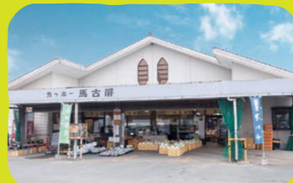
カッホー馬古屏 まごへい 「新鮮・安全・おいしい」商品を提供していくことをモットーに、地元で生産される農産物や加工品などの特産物を多彩にご提供しています。 嘉麻市牛隈882-1 ☎0948-57-2222 ☎8/13~15、12/31~翌年1/5 ☎8:30~17:00 MAP C-4