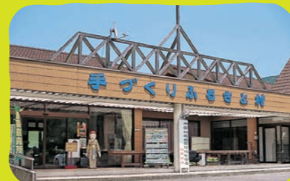
手づくりふるさと村(山田活性化センター) 農村部と都市部の交流を図るために誕生した、手づくりふるさと村(山田活性化センター)。とれたての野菜や木工品、手作りかりんとうなどを販売しています。 嘉麻市熊ヶ畑2141-1 ☎0948-53-1897 日曜、8/14~17、12/31~翌年1/5 ☎10:00~17:00 MAP D-5