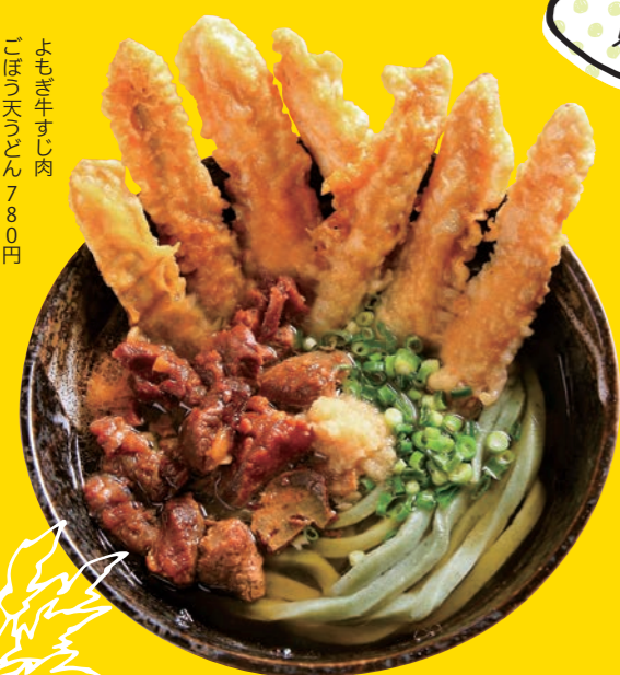
よもぎ牛すじ肉 ごぼううどん 780円