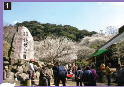
1 梅林公園観梅会 紅梅や白梅が咲き誇る嘉麻市梅林公園で行われ、売店も出店され多くの観光客で賑わいます。