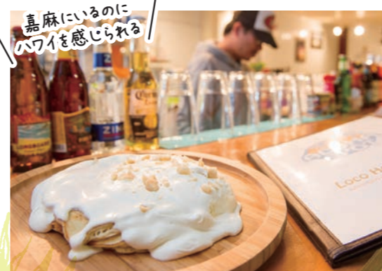
クリームブリュレ 550円