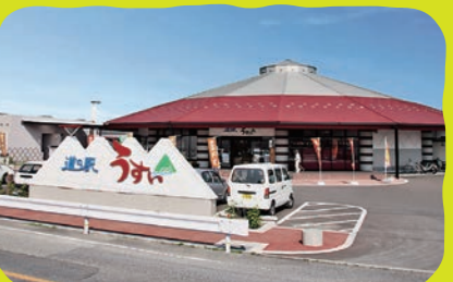
道の駅うすい 地元で愛情いっぱい育てられた新鮮な農産物と、玄界灘で捕れた新鮮魚介類を取り揃えた物産販売所や、パン工房・スイーツ店なども併設しています。 嘉麻市上臼井328-1 ☎0948-62-4400 ☎1/1~1/4 ☎9:00~18:30 MAP B-4