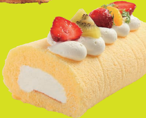
果麻ロール ふんわりとしたロール生地に優しい甘さの生クリーム。そして地元の旬な果物を使用した「果麻ロール」は多くの人に愛されるロンクゼラー商品です。(1本 1,280円) タルト&スイーツ F 嘉麻市上臼井328-1 ☎0948-62-2848 ☎10:00~18:30 日曜 MAP B-4