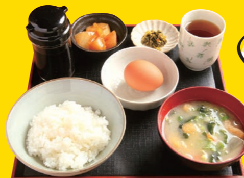
たまごかけごはん定食 324円(命水卵・命水米使用)