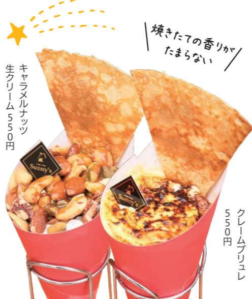
キャラメルナッツ生クリーム 550円