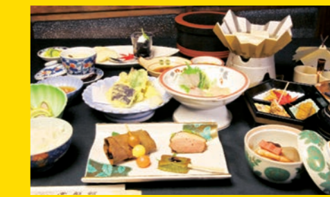
上/【冬季限定】ふぐコース料理 1万円(税別)~ 左下/ 昼の会席3,000円~ 夜の会席4,000円~(各税別)