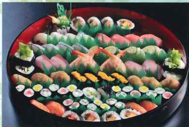
仕出し寿司盛り合せ