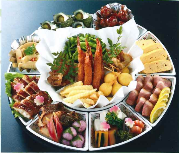
仕出し鉢盛り各種