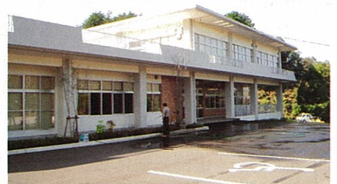
⑧山田いこいの家白雲荘