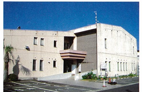
⑥嘉穂老人福祉センター