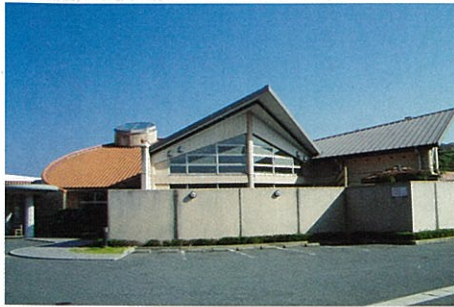
①ふるさと交流館なつきの湯