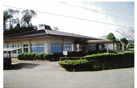
③稲築社会福祉センター