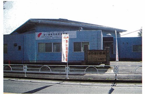
⑦山田ふれあいハウス