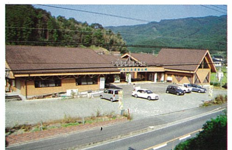
⑨山田活性化センター ふるさと手づくり村