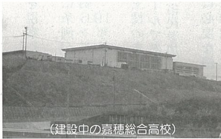
(建設中の嘉穂総合高校)

※このほかにも、「市バス、福祉バスの今後の考え方」、「11月15日に掲載された不当要求排除に関する記事について」、「第1次嘉麻市総合計画について」質問しました。