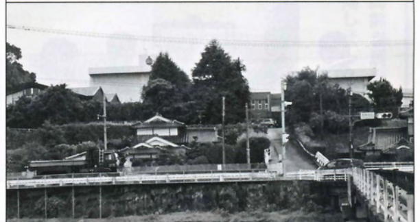
進入路が整備される稲築中学校前