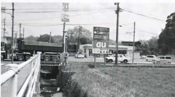
鴨生地区水害対策事業 (約1億2,700万円)