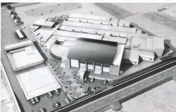
嘉穂地区小学校統合施設建設事業 (約12億9,600万円)