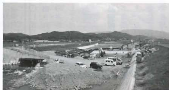
戸倉・柳原堰災害復旧事業 (約3億円)