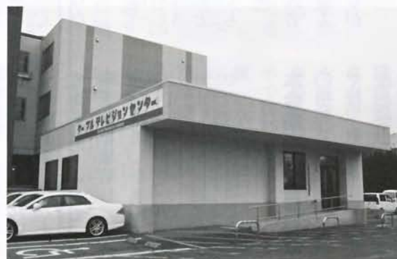
ケーブルネットワーク整備事業 (約20億円)