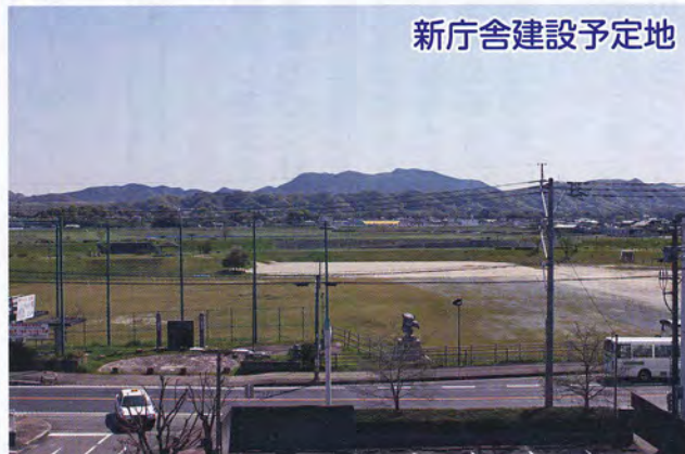
新庁舎建設予定地