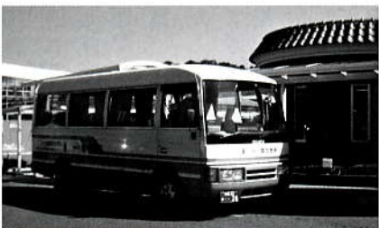
福祉バス(稲築地区)

富山社会福祉課長 今言われた内容で実施したい。ただ、実施時期については、関係機関との協議、乗り継ぎ等の時間調整もあり、実施できる時期が来たら、広報やチラシ等で周知を図りたい。