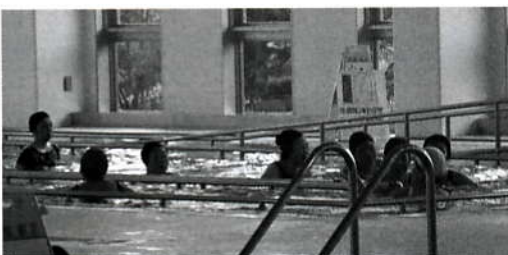
スイミングプラザなつき

有田農林整備課長 温暖化防止の為、森林の有する公益的機能が回復する事業を推進したい。市有林は遠賀川源流の森づくり推進会議の側面的応援を続け、带状間伐の推進を図りたい。