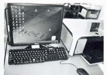
情報基盤の整備を

総務課長 不具合が起きれば、深夜であつても担当職員が対応している状況だ。このように故障が頻発している状況の中で、利用者への報告が遅れたことは危機管理意識不足と反省している。