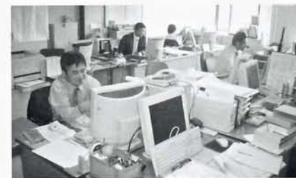
新設された生活相談係(碓井庁舎2階)