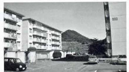
安心して暮せるために

委員より、単身で市営住宅等に入居している場合に同居人として暴力団員が入居していることが分かった時の市の対応に関する質問に対し、警察署に照会をかけ、入居者が暴力団員であることが判明すれば、単身で入居している方も含め退去していただくことになるとの回答がありました。 審査の結果、3議案とも全会一致をもって可決しました。