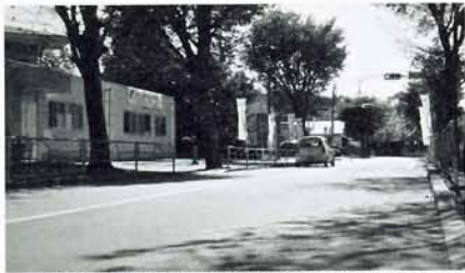
上山田小学校や山田庁舎も近い好立地