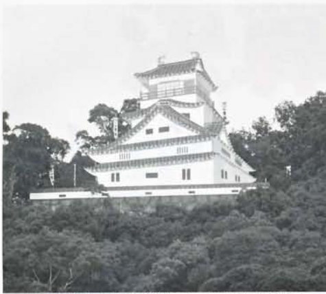
嘉穂益富城自然公園で開催される一夜城まつり(毎年10月下旬開催)