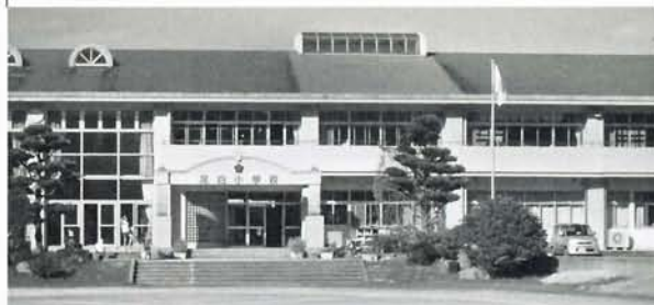
耐震補強工事(足白小学校ほか2校)