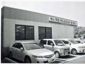
ケーブルテレビセンター

ケーブルテレビ事業を全市拡張し、IP電話を活用すれば、市内通話は無料となるため、市内と市外の割合を7対3と仮定した時、毎年3055万2千円の経費節減ができる。このようにケーブルテレビを有効活用すれば、運営費削減などに大きなメリットがある。また、今回のケーブルテレビ全市拡張事業の財源として、国の経済対策に関する臨時交付金を活用すれば、市の負担額が約1900万円である。実施できる事業であったが否決された。今後、この事業を実施するとすれば、有効な財源として合併特例債が考えられる。