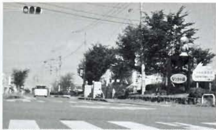
7月の集中豪雨で水害に見舞われた鴨生地区

降り、なつきの湯前の道路は川のようになり、銭代坊住宅、商店街へ流れ込み、また、子供の通学時間と重なり大変だったが、市長はいつも市民の生命と財産を守る事が使命だと言っておられる。 市民から夜、雨が降ると怖くて眠れないと精神的な不安の声も多く聞かれますが、市長はこの様な被害者の声にどう対応するのか。 松岡市長 私共行政は市民の生命、財産を守り安心・安全を保障する事が一番重要なものである。経費が掛かると思うが国・県に働きかけ経費を引き出し庁内で十分論議をして対応する。