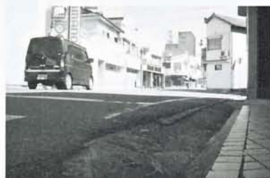
道路がかまぼこ状になっている(鴨生地区)