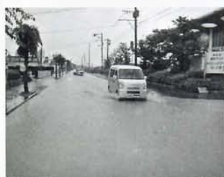
道路が冠水したなつきの湯前

市長 日本書紀にも記録されている嘉麻という名称、豊かな自然環境とフルーツの里、食の里、人を育むまち、山上憶良、山野の楽、益富城址、沖出古墳、鮭神社、安国寺、嘉穂総合運動公園、織田廣喜美術館等を十分に活かし、嘉麻市をアピールしていきたい。