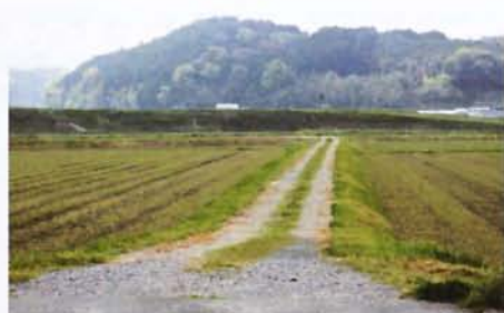
未舗装の農道（嘉穂地区）

質 市長はどう考えるのか。 質 市長はどう考えるのか。 市長 有害鳥獣については、県内特に農村部については深刻な問題となっており、福岡県市長会において、国に要望すべきとして議決をしている。 ※このほか①作業道と林道の違い及び里道の管理について②有害鳥獣防護柵の25年度事業について③稲築地区西