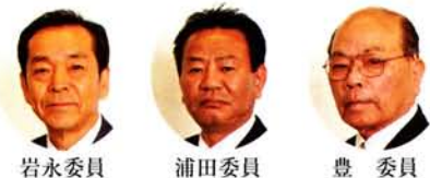
岩永委員 浦田委員 豊 委員