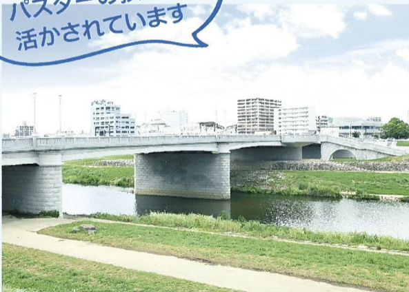
▲芳雄橋 地域文化を体現するため、天然石を基調とした重厚感のあるデザイン。