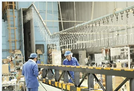
▼静電粉体塗装器 静電気を起こし、パウダーを吹き付けることで塗装を行なう機器。