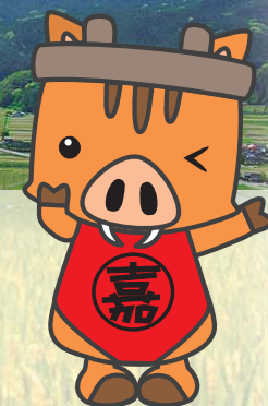
嘉麻市マスコットキャラクター ゆるキャラ係長 かましちゃん

福岡県のほぼ中央に位置し、県内3大都市圏である福岡市、北九州市、久留米市までそれぞれ自動車で1時間の距離にあります。