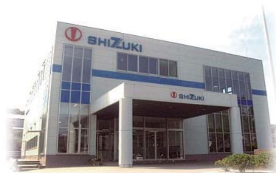
誘致企業 九州指月株式会社

*上記のほかに、条例に定める条件に合致すれば固定資産税の課税免除（初年度から3年目までは100%、4年目60%、5年目30%）もあります。