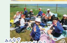
みんなで お弁当を楽しみました!