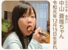
口春 / 6歳 / 女の子 突然撮るから気を抜いたやん～