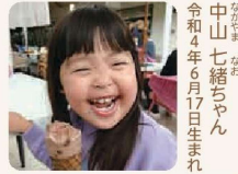
口春 / 4歳 / 女の子 チョコアイス美味すぎる～☆