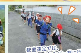
歓迎遠足では、 1年生と6年生が一緒に行動!