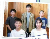
計画委員会の 6年生のみなさん

明るい声があふれる学校にしたいと思い、あいさつ運動をしています。みんな元気よく声をかけ合っていて、礼儀正しくやさしいです。学年関係なく仲がよいところも大好きです。