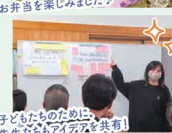
子どもたちのために、 先生たちもアイデアを共有!