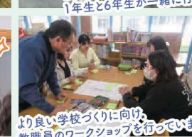
より良い学校づくりに向け、 教職員のワークショップを行っています。