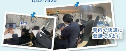
車内で快適に受講できます!

ソフトバンク株式会社にご協力いただき、「山田生涯学習館」「バス来る嘉麻」「碓井住民センター」「なつきの湯」の各駐車場において、専用車両での移動型スマホ教室を開催します! 車内には3つの座席があり、それぞれに講師を映し出すタブレット、操作をしていただくスマートフォンを準備しています。 エアコンが効いた快適な車内です!