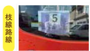
バスの側面(出入口)に表示