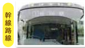
バスの前方上部に表示