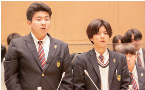
稲築志耕館高等学校