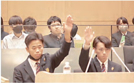
稲築志耕館高等学校

係長 過去に公園にゴミ箱を設置していたことはあるが、公園のゴミ箱に家庭ごみが捨てられて、不法投棄をする人が非常に多かった。公園をきれいにするためのゴミ箱が、かえってゴミ箱周辺のゴミを片づける手間がかかるようになったため撤去した。公園で発生したゴミは、各自が責任をもって持ち帰り、分別するよう理解と協力をお願いする。