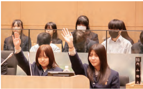
嘉穂総合高等学校 嘉麻市立大隈城山校