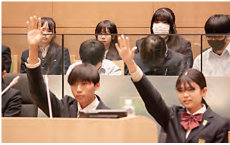
稲築志耕館高等学校