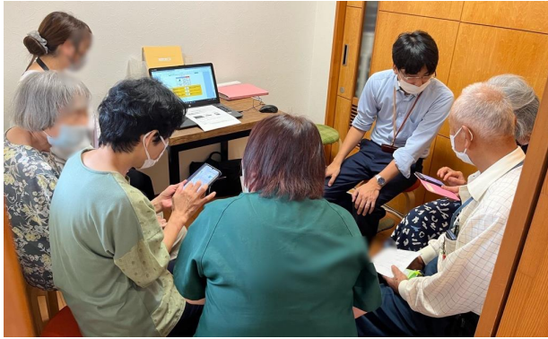
令和6年7月11日(木)開催