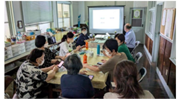
令和6年7月11日(木)開催