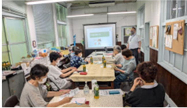
令和6年7月2日(火)開催