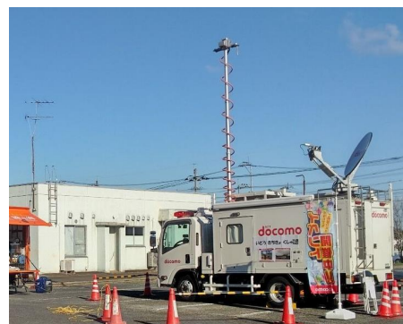
移動基地局の様子