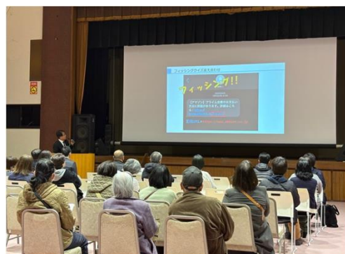
デジタルに関する基調講演の様子