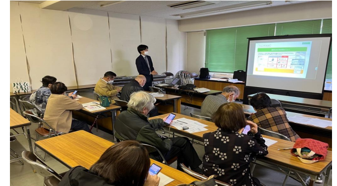
令和6年11月22日(金)開催