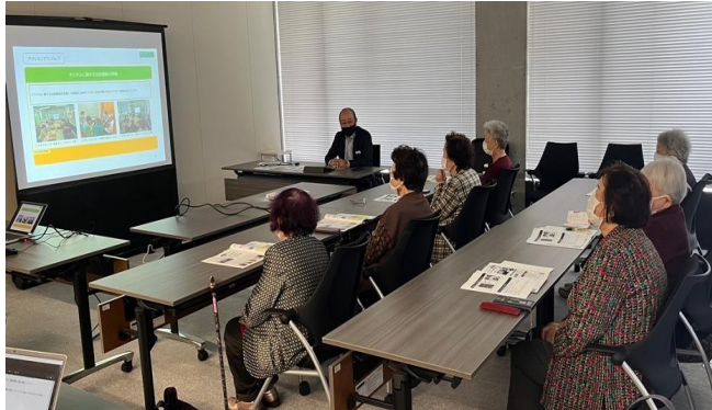
令和6年11月6日(水)開催