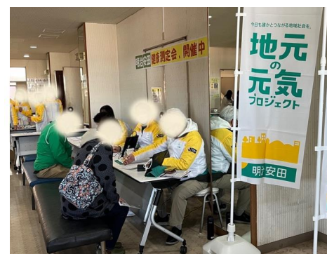
デジタルによる血管年齢測定等の様子