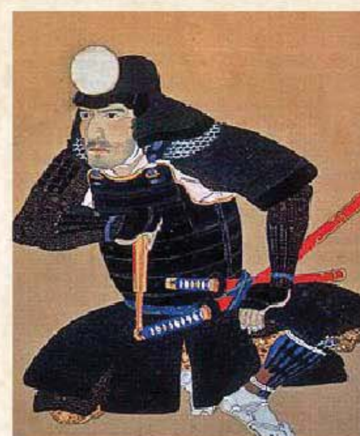
後藤又兵衛(ごとうまたべえ)の肖像 福岡市博物館所蔵