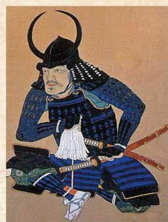
母里太兵衛(ぼりたへい)の肖像 福岡市博物館所蔵