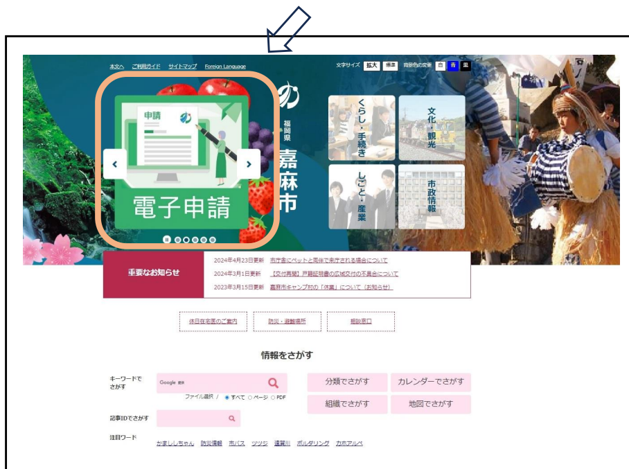
△嘉麻市ホームページ

転入・転出、子育て・介護・被災者支援、水道関係、通学等補助金交付申請、歴史民俗資料展示・保管施設利用許可申請書、国民年金関係、普通徴収から特別徴収への切替届出書 等