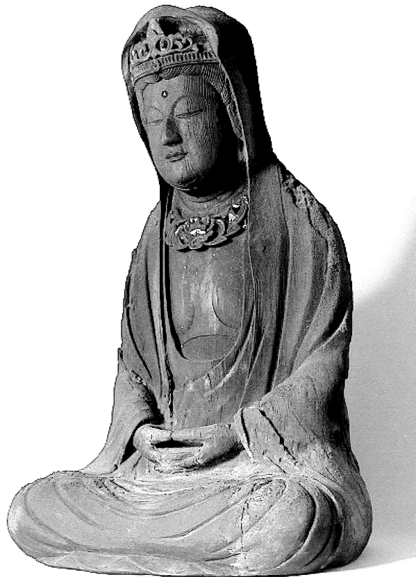
木造白衣観音坐像（福岡県指定有形文化財）