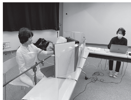
文化財ボランティアの活動の様子