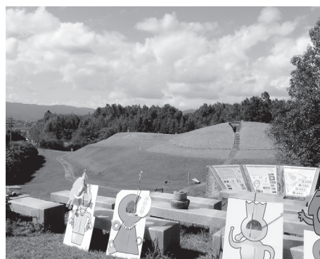
特別公開時の様子