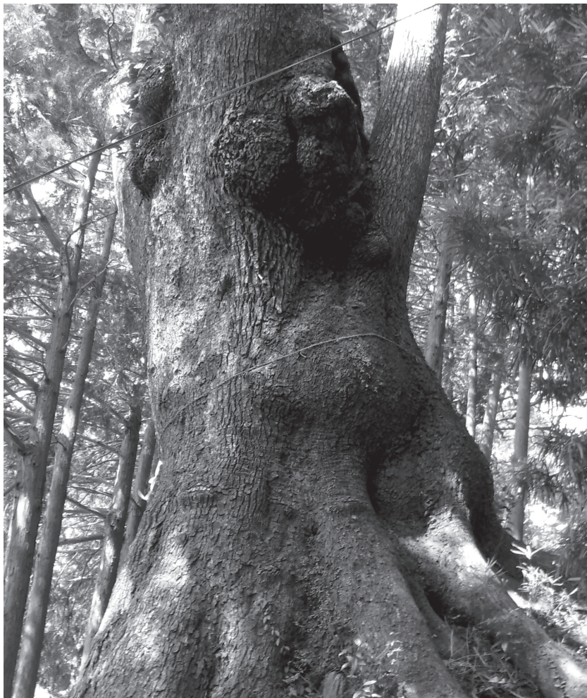
北斗宮の大クス (市指定天然記念物)