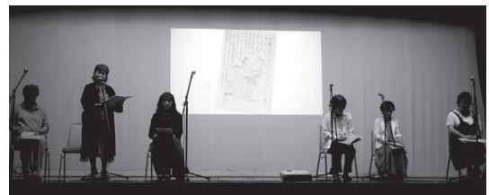
朗読ボランティアによる朗読会