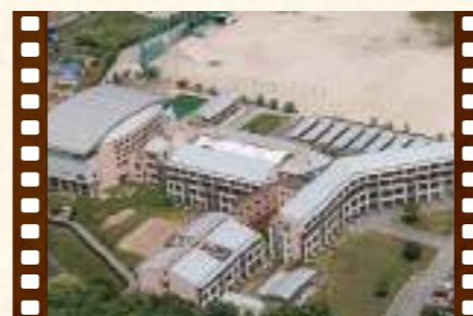
平成9年に稲築志耕館高等学校校舎完成