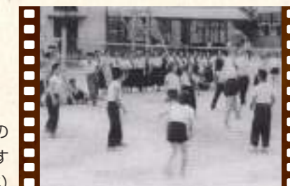
稲築高等学校時代の クリスマスマッチのようす (昭和28年)

これからも長い歴史の中で培われてきた文化や想いを 紡いで参ります。どうぞよろしくお願いいたします。