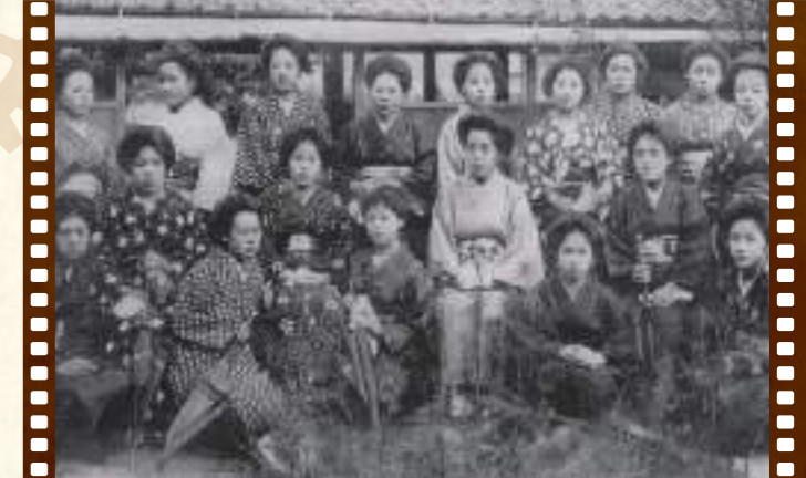
稲築村立実業補習学校の生徒たち (大正12年)