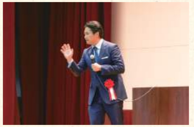
講演する杉村 太蔵さん