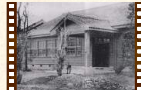
高等実業女学校校舎 (昭和16年)