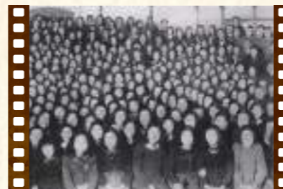
高校移行に喜ぶ生徒たち(昭和23年)