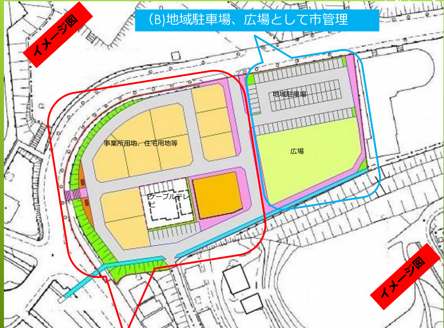
(A)民間活力活用敷地

確定した購入者と利活用について協議後、生活道路等を分筆し、利活用地確定後鑑定等を行い、売買金額を確定する。