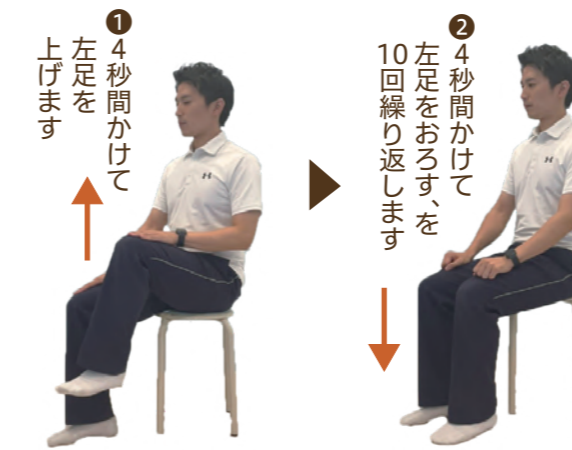
左右逆にして、反対側も同様に行います