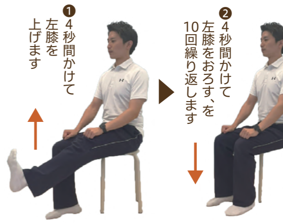
左右逆にして、反対側も同様に行います