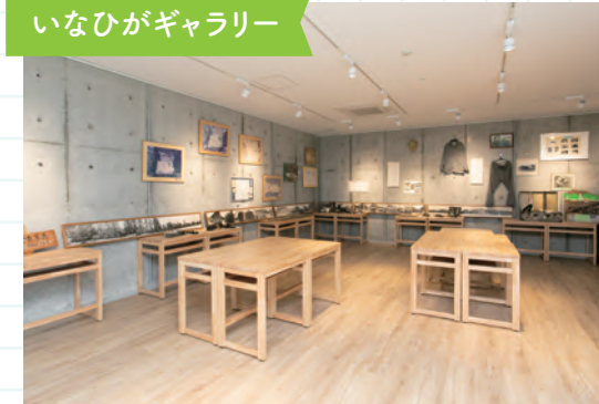
いなひがギャラリー