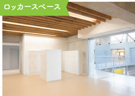
ロッカースペース

全学年、ロッカーは教室外に設置し、学習空間と生活空間を分けたメリハリのある教室周りになっています。