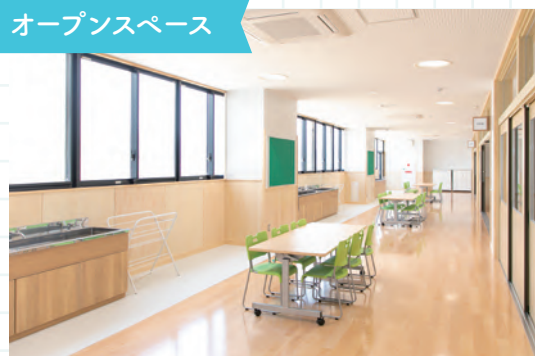
オープンスペース

1年生から6年生は学年ごとに空間を区切ってあり(学年ユニット)、教室前のオープンスペースを教室と一体的に使用し、様々な活動に対応できるようになっています。