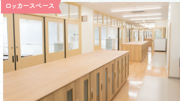
ロッカースペース

7年生以上は教室外にロッカースペースを設け、学習空間と生活空間を分けたメリハリのある教室周りになっています。