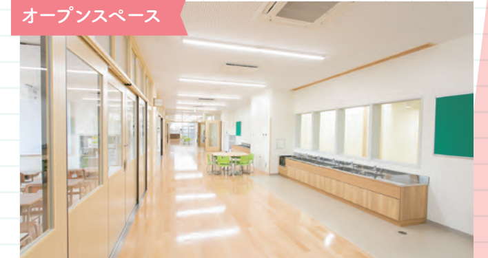
オープンスペース

1年生から6年生は学年ごとに空間を区切ってあり(学年ユニット)、教室前のオープンスペースを教室と一体的に使用し、さまざまな活動に対応できます。