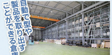
自動で型や 製品を取り出す ことができる倉庫。