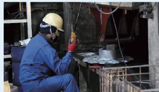
手作業で仕上げ作業を行います。