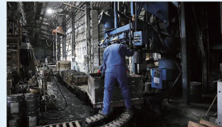
鋳造に必要な砂型の製造工程。