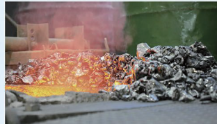
材料をつくることから行います。