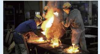
砂型に溶かした材料を入れ成型。