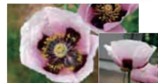
植えてはいけないけし(アツミゲシ)