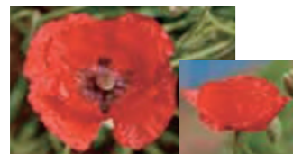
植えても良いけし(ヒナゲシ)

このようなけしを見かけたら、 嘉穂・鞍手保健福祉環境事務所 ☎21-4876 または、警察署までご連絡ください