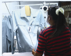
▲形状記憶を行う前の成形作業