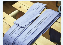
▲研究・開発中のマスク