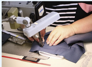
▲作業着の縫製作業