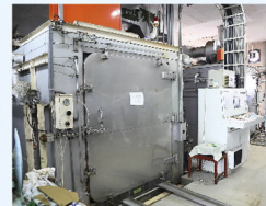
▲ガスで形状記憶を行う専用機械