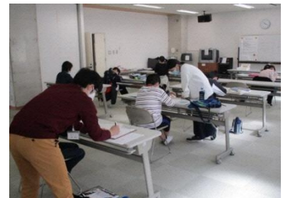
嘉麻市土曜未来塾