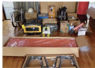
地域が整備している資器材