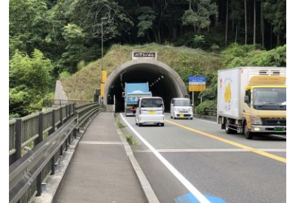
八丁峠トンネル付近