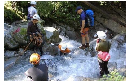
シャワークライミング