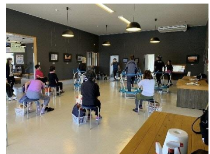
ケアトランポリン