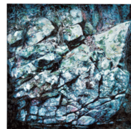
洋画部門 福岡県知事賞 「生命」横尾保馬作

〒820-0502 嘉麻市上臼井767 TEL:0948-62-5173 FAX:0948-62-5171 9:30~17:30(入館は17:00まで)