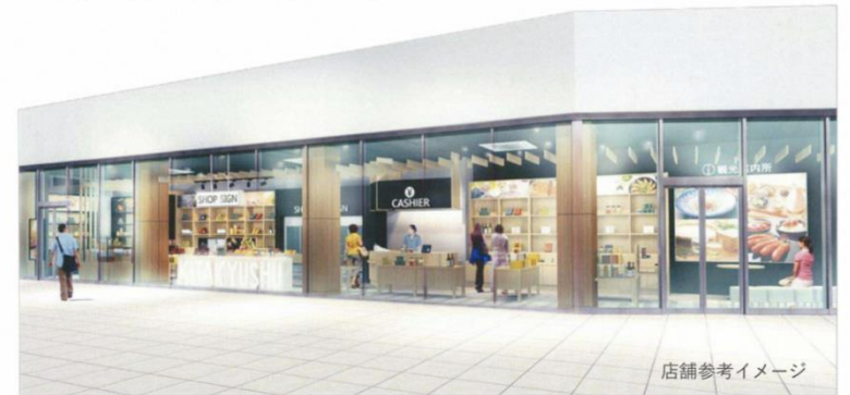
店舗参考イメージ