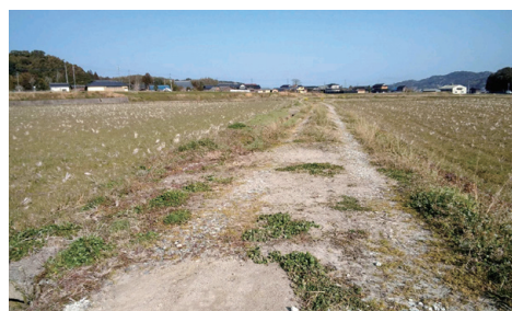
▲嘉麻市椎木の農道

質 近年では、高齢化や担い手不足で農道の整備は難しく、悪路により転倒事故等がいつ起きてもおかしくない状況だ。しっかりと計画を立て、スピード感を持って取り組んでほしい。 農林振興課長 今後の展開としては、各農事区からの要望を受け、補助事業の要件を満たす箇所や利用者数並びに危険度かんがみ、多面的な支払交付金及び農村環境整備事業を十分に活用し、継続的に実施していく。 ※他にスマート農業を質問。