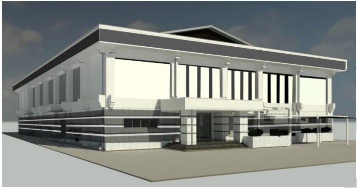
△大隈体育館改修外観イメージ