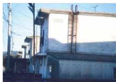
▲老朽化した改良住宅

質 改良住宅の住人は、公営住宅に住む以外に方法はなく、生活選択の幅が著しく制限されている。長寿命化計画はどのように実施するのか。 住宅課長 入居者の安全を第一に考慮し、社会資本整備総合交付金等を活用し、老朽化対策を進めていきたい。 意見 住生活基本法の理念は、住生活の安全確保である。住居水準の向上や高齢者対策等