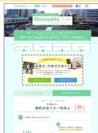
Omoiyalty Drive TOP ページ

Omoiyalty Drive キャンペーン URL : https://omoiyalty.jp/